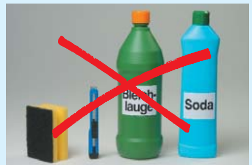
Keine aggressiven Werkzeuge oder Mittel verwenden!