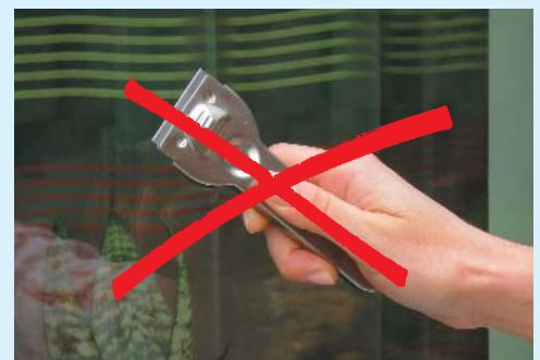
Keine metallischen Gegenstände!