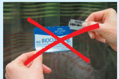
Etikett nicht mit metallischen Gegenständen abkratzen!