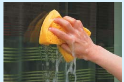
Mit viel klarem Wasser oder neutralen Glasreinigern säubern