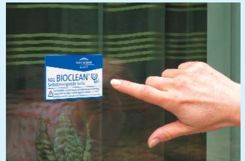
SGG BIOCLEAN-Etikett auf der Beschichtung